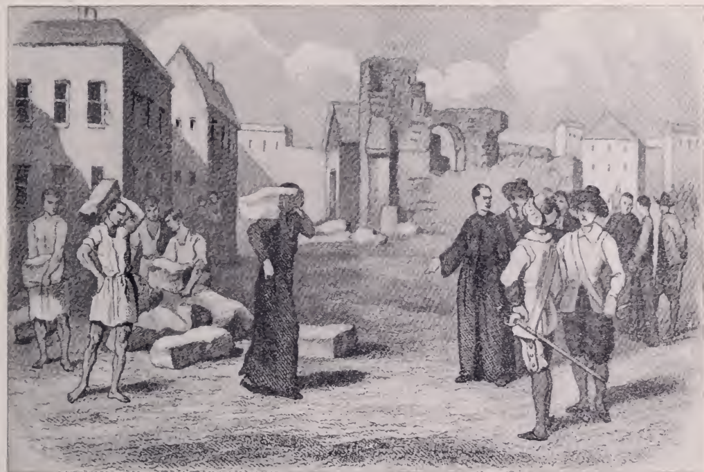
Fray Juan de los Barrios trae sobre sus hombros la primera piedra para la nueva iglesia catedral. (Grabado francés del siglo pasado).